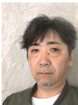
グラフィックデザイナー