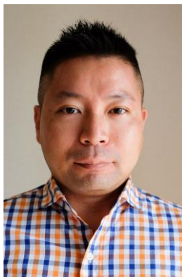
ローカルフードデザイナー