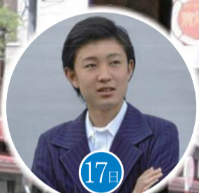
和服の特別ステージ