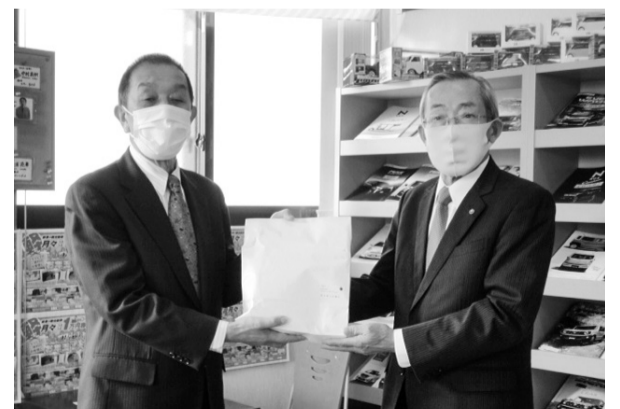
新岡会頭、桑田・福原両副会頭も配達を行った

会員の事業の継続と安定を最優先と考え、職員一丸となって、経営相談や各種支援策の情報提供に努めるほか、中小・小規模企業に対する迅速な支援施策の実現に取り組んでいます。