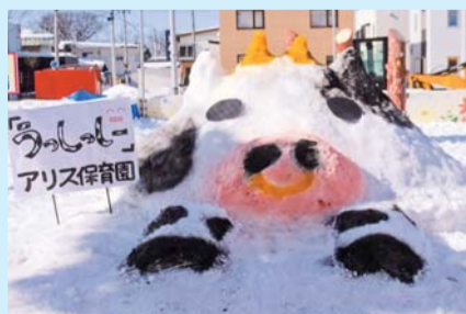
入選「うっしー!」 アリス保育園