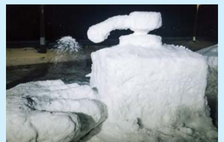
入選「手指を消毒! みんなで感染予防しよう!」 追子野木地区子ども会育成連合会