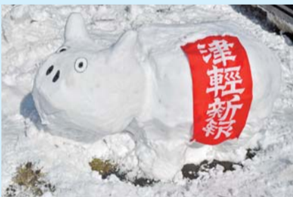
入選「津軽新報の白ベコ」 津軽新報社