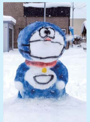
入選「みんなでマスクをつけよう!!」 境 志遠