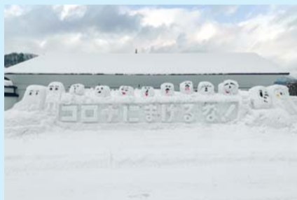
入選「コロナにまけるな」 津軽伝承工芸館