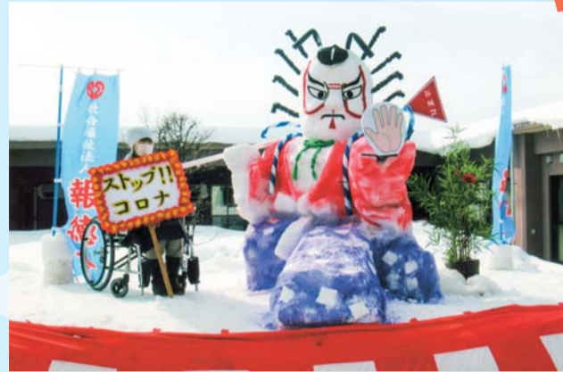
黒石商工会議所会頭賞 「ストップ!!コロナ 社会福祉法人 報徳会