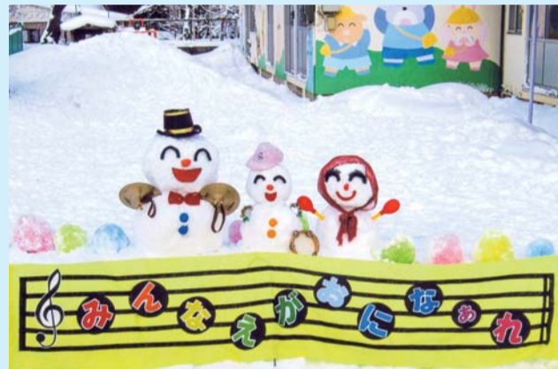
黒石商店街協同組合理事長賞 「みんなえがおになあれ」山形こども園