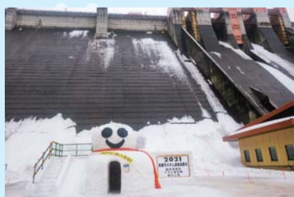
入選「遊べる雪だるまさん」 浅瀬石川ダム連絡協議会 (株)桜庭建設、アサヒ建設(株)、(株)村上組