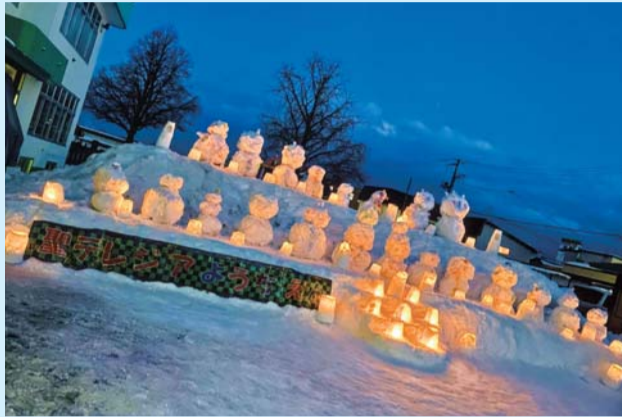
黒石市長賞 「心に炎を灯して遠い未来まで…」聖テレジア幼稚園