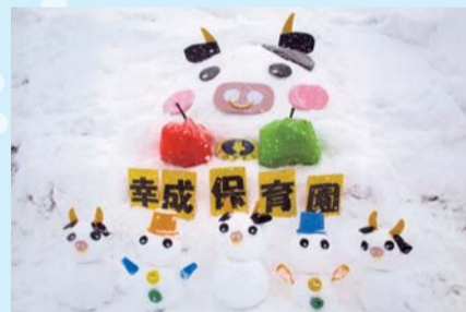
入選「幸成うしだるま～コロナウイルスに負けないぞ～」 幸成保育園