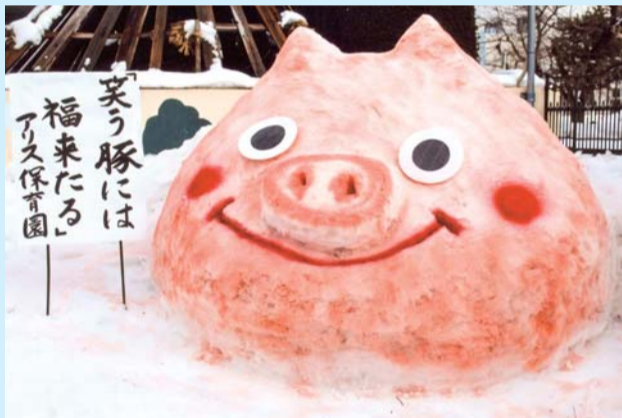
黒石観光協会長賞 「笑う豚には、福来たる」アリス保育園