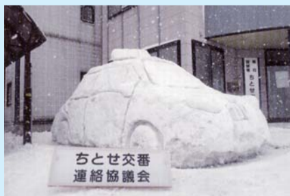
入選 白銀に浮かぶ「110」 ちとせ交番連絡協議会