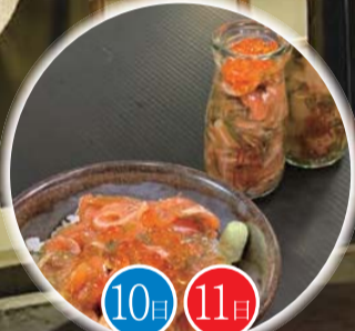
岩手県宮古市の 物産展