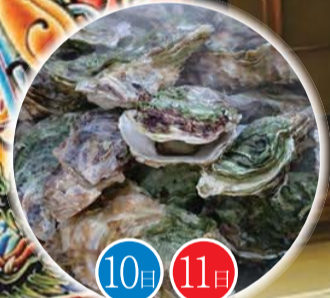
岩手県宮古市の 蒸し牡蠣