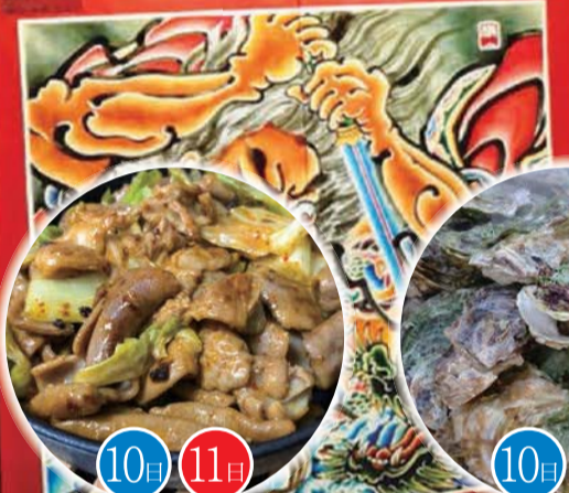
秋田県大仙市の ホルモン焼き