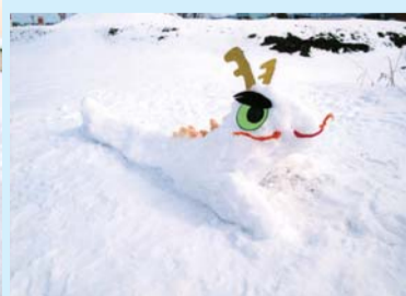
入選「来たぞ!伝説の白龍」 こどもデイサービスセンター Sky