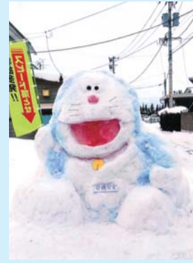
「横断歩道手前で徐行お願い」 石澤英樹