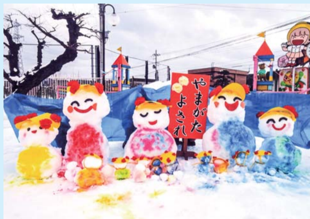
黒石市長賞 「元気に踊ろう!エッチャホー!!」山形こども園