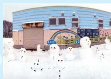
入選「みんなで雪だるま」 追子野木地区子ども会育成連合会