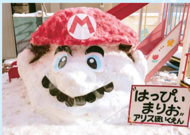
黒石観光協会会長賞 「はっぴいまりお」アリス保育園