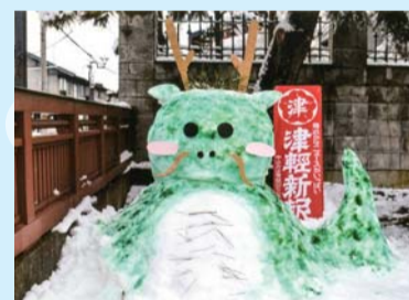
入選「津軽新報のドラちゃん」 (株)津軽新報社