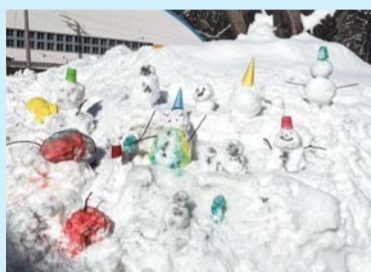
入選「中(ちゅう)、多様性。」 黒石養護学校 中学部