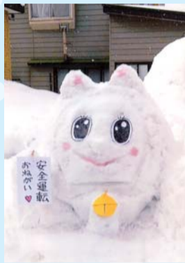
「ドラミちゃんどんな時もニコニコ」 石澤英樹