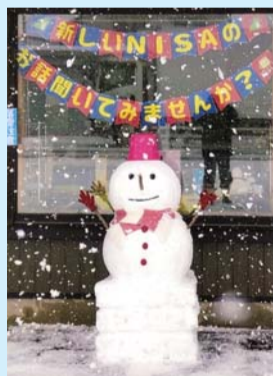
入選「ウェルカムだるま」 中郷郵便局