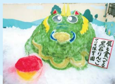
入選「辰も食べてる黒石りんご」 アリス保育園